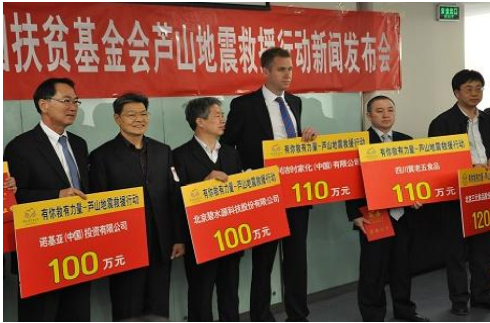
通过中国扶贫基金会向灾区捐赠 100 万