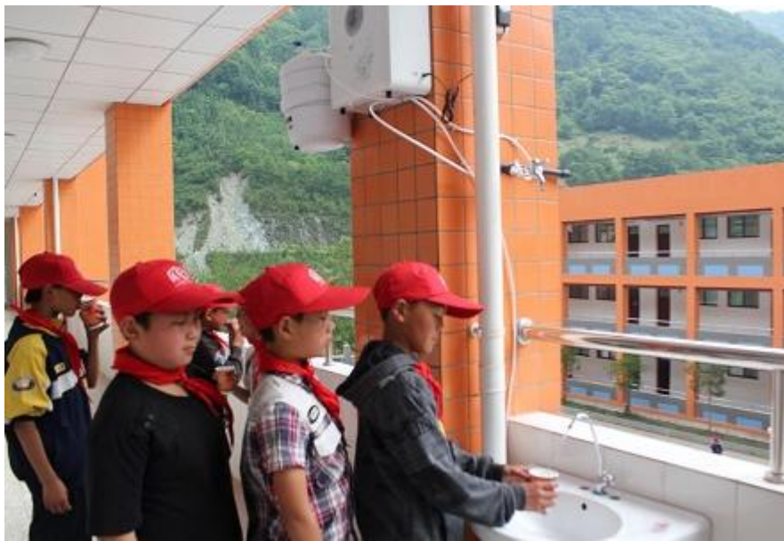
灾区重建，校园内安装碧水源净水器保障饮水安全

2、公司与北京市团市委、苏宁易购等企事业单位合作，派出专业团队进机关、下基层、到社区以多种形式传递饮水健康知识，让更多的人节约水资源、保护水环境、科学饮水、健康生活。